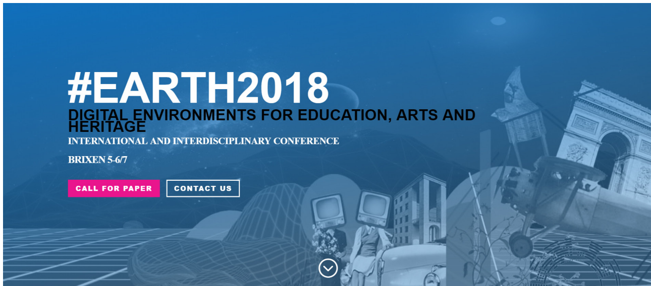
Fig. 1. International and Interdisciplinary Conference #EARTH2018 - Digital Environments for Education, Arts and Heritage.

conferenza sia «uno di quei temi di frontiera» che un'associazione scientifica come l'UID deve assolutamente coltivare. Rilevando poi come le realtà nuove, più giovani, più piccole quali quella di Bressanone siano quelle più favorevoli a «operare come avanguardie», ha ribadito l'importanza di coltivare relazioni trasversali, multidisciplinari e "transdisciplinari" cercando di travalicare i confini del settore scientifico-disciplinare e di comprendere le specificità e le ragioni degli altri. Il secondo ha definito l'evento come un'interessante «trama intricata e intrigante» in cui l'intreccio di diversi percorsi disciplinari possono trovare un terreno fertile per condividere pratiche e processi interpretativi intorno alle tematiche dei media, della formazione e delle tecnologie digitali concorrendo a sviluppare nuove chiavi di lettura utili