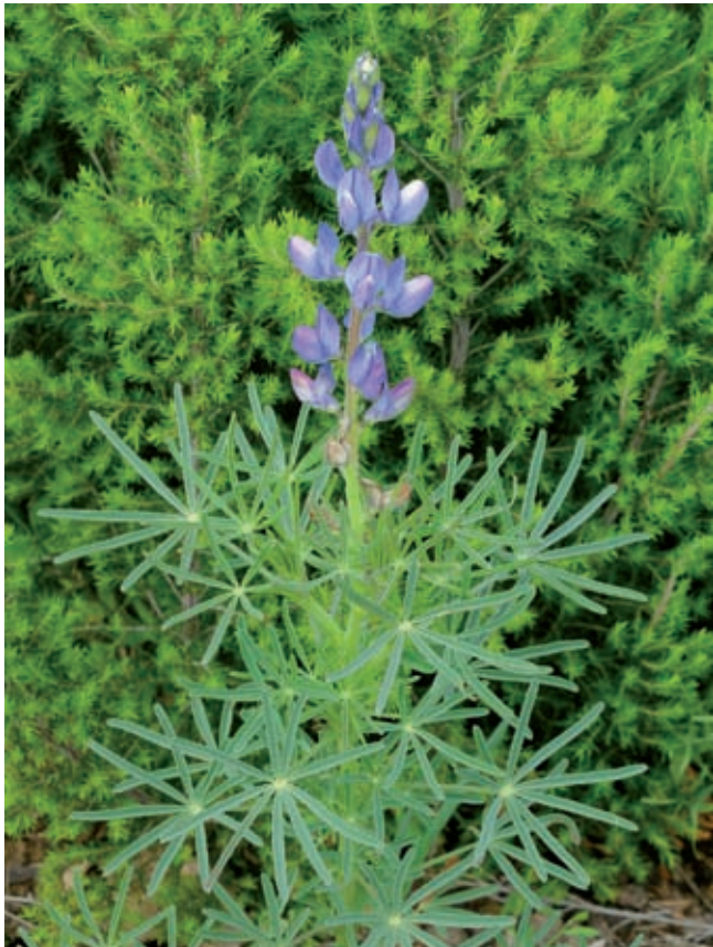
Fig. 6 - Lupinus angustifolius L..

S. Venanzo (Terni), P.gio la Capra versante S-SO (UTM WGS84: 33T 270006.4757024), cerreta ceduata di recente, suolo calcareo, 475 m, 27 Apr 2016, F. Falcinelli (APP); ibidem (UTM WGS84: 33T 269982.4756993), 2 Iul 2016, F. Falcinelli (APP); Città della Pieve (Pe-