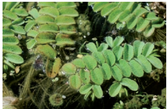
Fig. 8 - Salvinia natans (L.) All. (foto M. Paolucci).

In Abruzzo questa specie è stata segnalata in passato presso Tossicia (Crugnola, 1900), ma non è stata confermata in tempi recenti. È dubbio se la nuova stazione sia di origine naturale o provenga da materiale d'acquario naturalizzatosi.