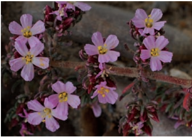
Fig. 3 - Frankenia hirsuta L..

Kickxia spuria (L.) Dumort. subsp. integrifolia (Brot.) R.Fern. (Plantaginaceae)