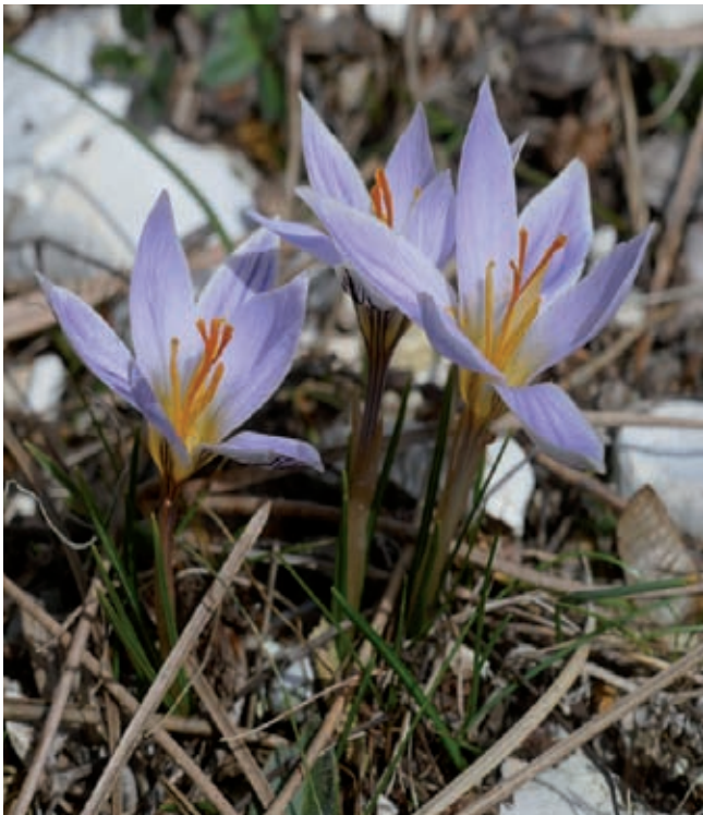
Fig. 2 - Crocus variegatus Hoppe & Hornsch..