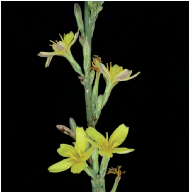
Fig. 4 - Lactuca viminea (L.) J.Presl & C.Presl subsp. chondrilliflora (Boreau) St.-Lag..

Trevi (Perugia), M. Matigge presso la sommità (UTM WGS84: 33T 316384.4753051), pascolo rupestre, suolo calcareo, 580 m, 30 Mar 2016, F. Falcinelli (APP); ibidem , versante NE (UTM WGS84: 33T 316452.4753124), pascolo rupestre, suolo calcareo, 580 m, 13 Aug 2016, F. Falcinelli (APP).