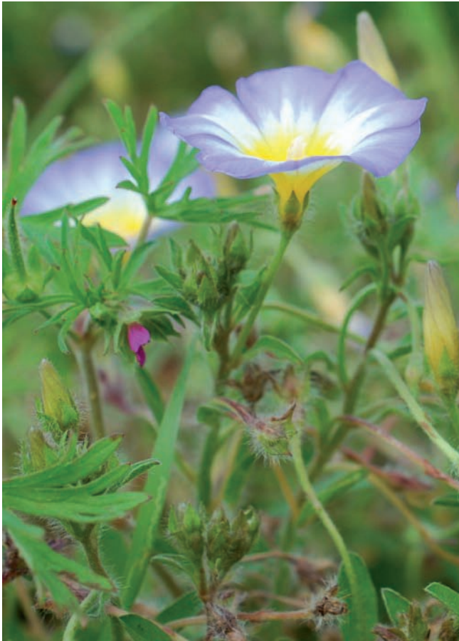
Fig. 1 - Convolvulus tricolor L. subsp. cupanianus (Tod.) Cavara & Grande (foto M. Paolucci).