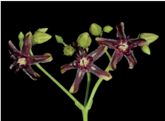
Fig. 13 - Periploca graeca L..

Bevagna (Perugia), Palombaro tra la SP 403 di Bevagna e il cimitero di Capro (UTM WGS84: 33T 304170.4758274), scarpata, suolo calcareo, 205 m, 1 Mai 2016, F. Falcinelli (APP); ibidem , 22 Iul 2016, F. Falcinelli (APP).