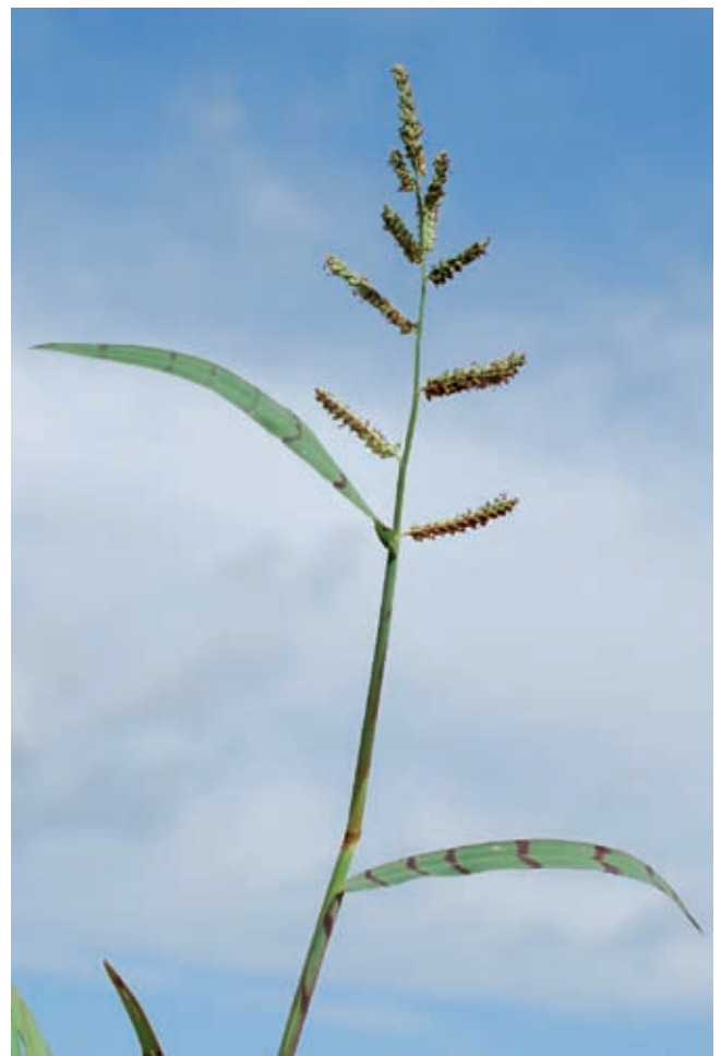
Fig. 11 - Echinochloa colona (L.) Link.