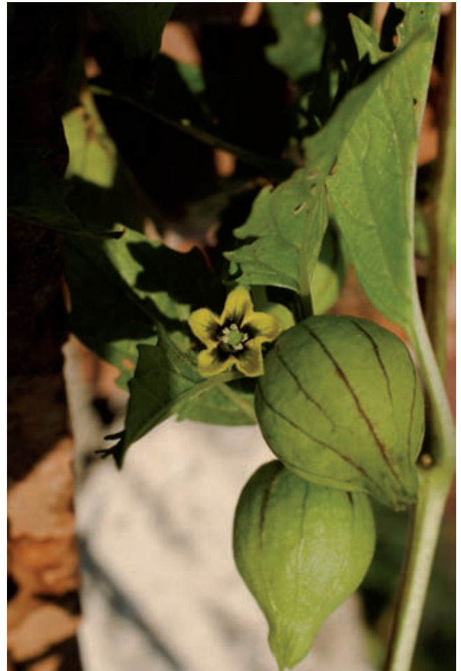
Fig. 14 - Physalis ixocarpa Brot. (foto D. Palermo).

San Benedetto del Tronto (Ascoli Piceno), Monte della Croce (UTM WGS84: 33T 406970.4754627), 215 m, 17 Mai 2017, F. Conti (APP).