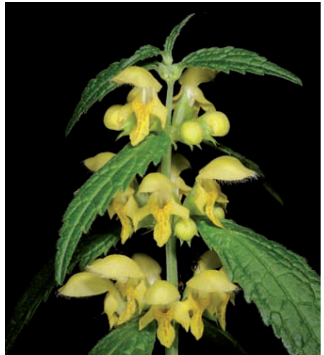
Fig. 5 - Lamium galeobdolon (L.) L. subsp. flavidum (F.Herm.) A.Löve & D.Löve.

Pizzone (Isernia), Casone del Medico, 1250, 26 Mai 1992, F. Conti (APP, n. 22503); sopra Pizzone (Isernia),