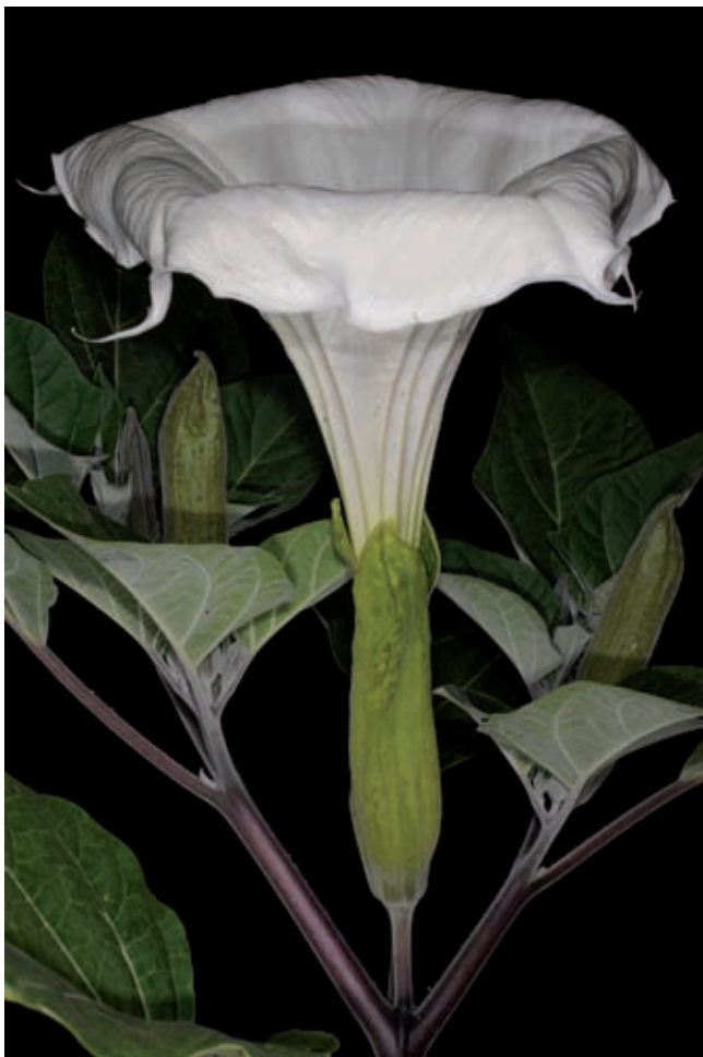
Fig. 10 - Datura wrightii Regel.

Perugia (Perugia), vicinanze di Fontignano, Montali versante SE-E (UTM WGS84: 33T 270920.4768206), oliveto abbandonato, suolo calcareo, 410 m, 4 Iun 2016, F. Falcinelli (APP).