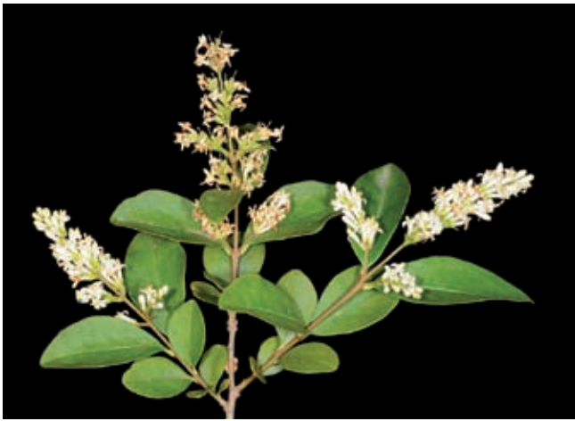
Fig. 12 - Ligustrum ovalifolium Hassk..