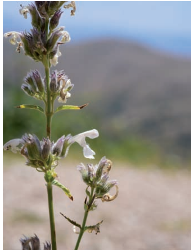
Fig. 7 - Nepeta nepetella L. subsp. nepetella.

Entità nota in Italia per Valle d'Aosta, Piemonte, Liguria, Marche, Umbria, Lazio e non confermata per l'Abruzzo (Conti et al. , 2005a).