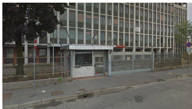
Uno degli ingressi su strada