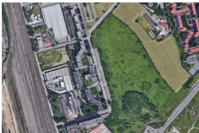
Vista aerea del comparto

La rigenerazione di comparto consente infatti di approfondire e sperimentare un vasto panel di tematiche di stringente attualità, che potranno comprendere, a titolo indicativo e non esclusivo, aspetti quali: la sostituzione edilizia con nuove costruzioni orientate a criteri di resilienza urbana, efficienza energetica e innovazione tecno-tipologica; il progetto degli spazi pubblici e della loro accessibilità; la definizione e il progetto di servizi urbani per il quartiere e la collettività, con l'individuazione di nuovi modi dell'abitare urbano e di mix funzionali efficaci e innovativi che integrino residenza, servizi e attività produttive legate all'industria di nuova generazione e all'artigianato evoluto; l'impiego di tecnologie ICT per l'informazione, la sicurezza, il monitoraggio e l'efficienza ambientale; la valutazione di alternative e fattibilità, anche con ipotesi di recupero e/o trasformazione degli immobili esistenti e analisi di mercato; le problematiche della cantieristica, anche con proposte orientate a pratiche innovative quali cantieri eventi/cantieri scuola ecc; gli aspetti della gestione, del recupero e del riciclo dei materiali provenienti dalle demolizioni; l'innovazione di processo nel management del progetto, inclusa la proposta di modelli partecipativi e condivisi.