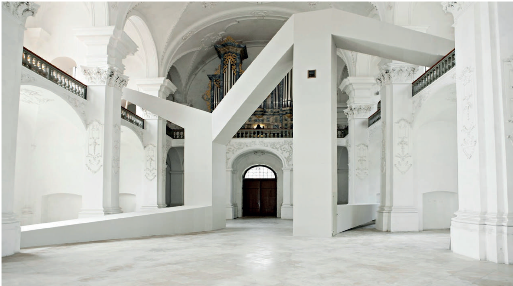
Fig. 6 Florian Graf, Be, Leave, chiesa dell'abbazia di Bellalay, Svizzera, 201.