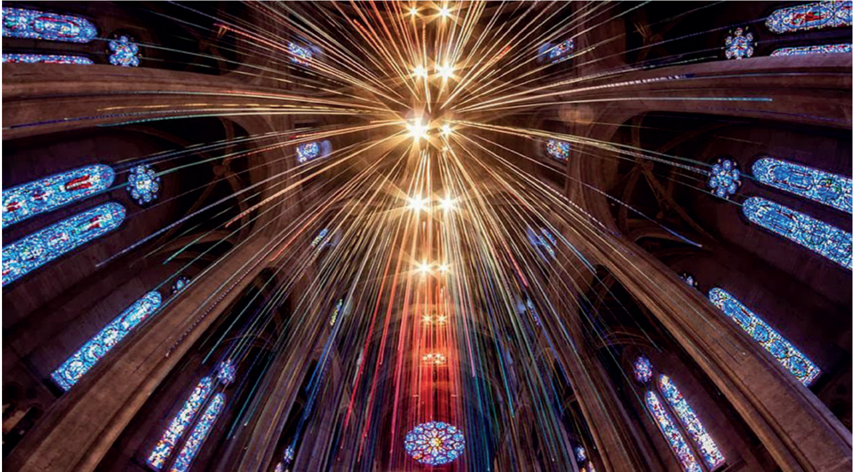
Fig.2 Anne Patterson, Graced By Light, Grace Cathedral, San Francisco (USA), 2014.