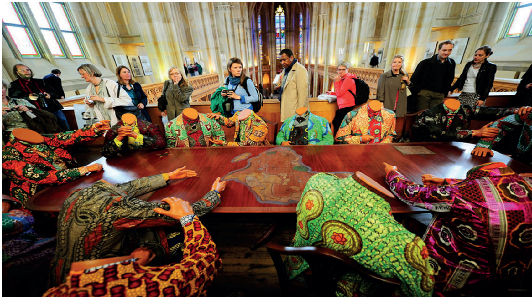
Fig.3 Yinka Shonibare, The Scramble for Africa, Friedrichswerdersche Kirche, Berlino, 2010.