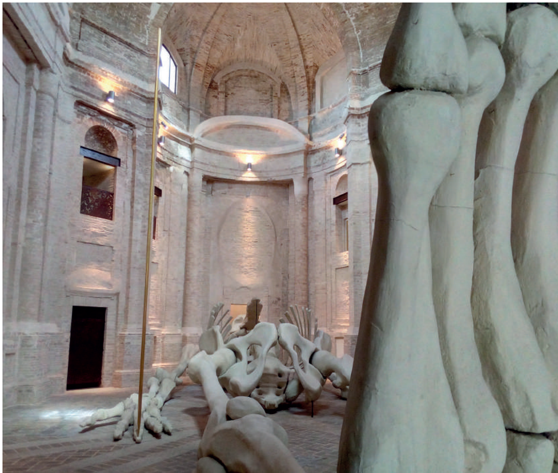
Fig.7- Gino De Dominicis, Calamita Cosmica, chiesa della Santissima Trinità in Annunziata, Foligno, dal 2010.

la prima volta esposta al pubblico nel 1990, presso il Centre National d'Art Contemporain di Grenoble, che ospitava una mostra antologica su Gino De Dominicis. L'opera rappresenta un monumentale scheletro dalle fattezze antropomorfe; il naso a becco e l'asta d'oro che poggia sul dito medio della mano destra rappresentano, oltre che una cifra stilistica, elementi di disorientamento, termini ignoti che De Dominicis inserisce per mettere in atto riflessioni sulla fisicità, sulla morte, sul tempo e sullo spazio cosmico, sue tematiche ricorrenti 47 (Fig. 7, Fig. 8). Per la prima uscita pubblica l'artista decide di collocare l'opera in una sezione distaccata del polo museale francese e di permetterne l'osservazione da un unico punto di vista, posizionato dietro al cranio dello scheletro, impedendo allo spettatore di avvicinarsi eccessivamente 48 . Nel 1996 la "Calamita" è esposta al museo di Capodimonte di Napoli, nel cortile della Reggia, dopo essere rimasta in deposito proprio a Foligno presso un capannone industriale. Conclusa la mostra napoletana, l'opera rimane per qualche tempo a Capodimonte e, a seguito della morte di De Dominicis nel 1998, è acquistata nel 2003 dalla Fondazione Cassa di Risparmio di Foligno 49 . Fino al 2010 l'ente organizza diverse manifestazioni e concorda prestiti con istituzioni straniere 50 , fino a quando decide di dare una dimora definitiva allo 'scheletro', scegliendo come sede l'ex chiesa della SS. Trinità in Annunziata, edificio sacro nel centro