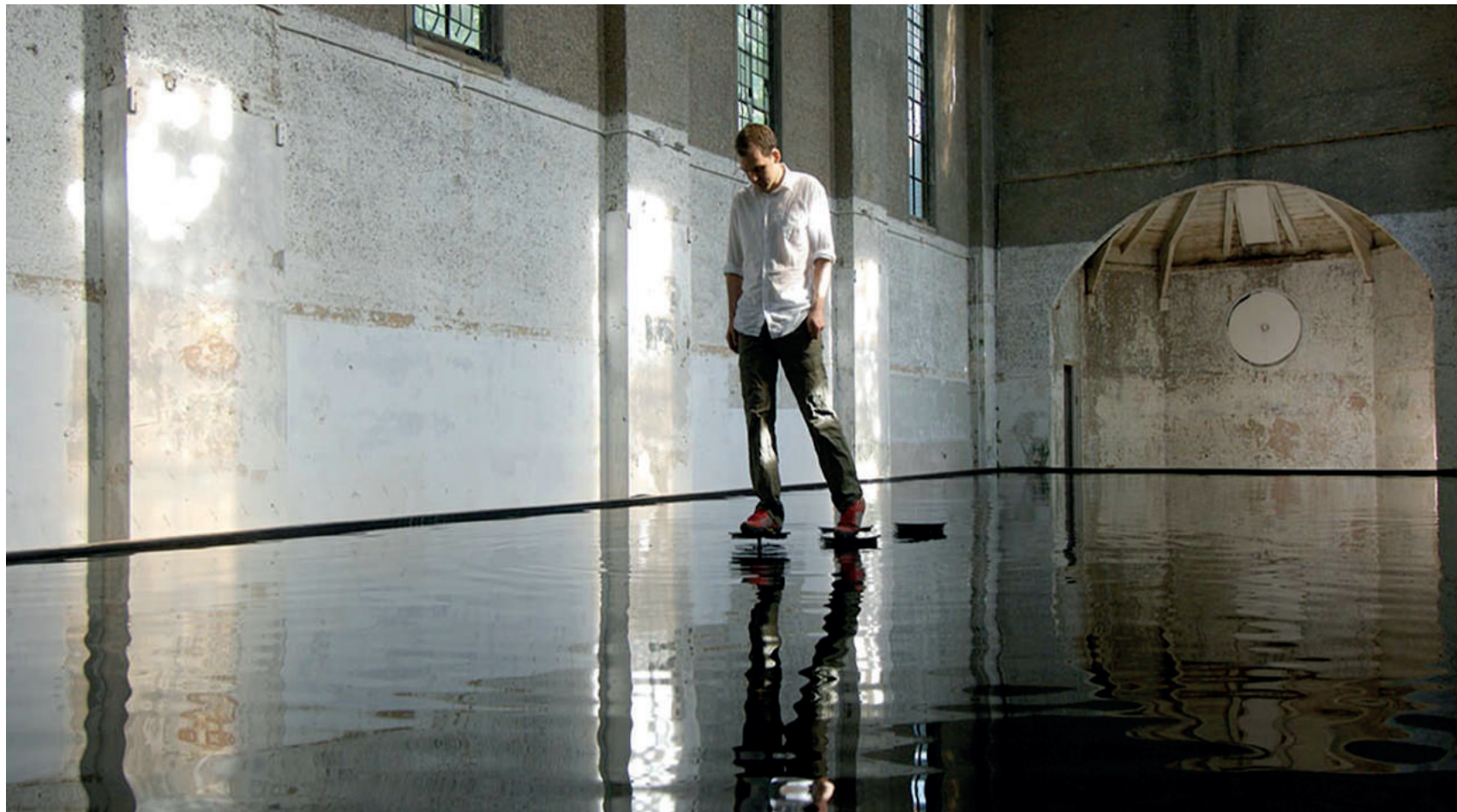
Fig. 4 - Michael Cross, The Bridge, Dilston Grove, Londra, 2006.