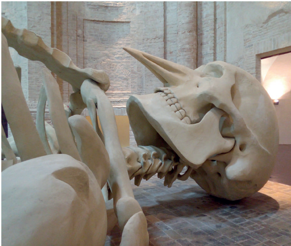
Fig.8- Gino De Dominicis, Calamita Cosmica, chiesa della Santissima Trinità in Annunziata, Foligno, dal 2010.

Il 27 ottobre 2010 il Comune di Foligno e la