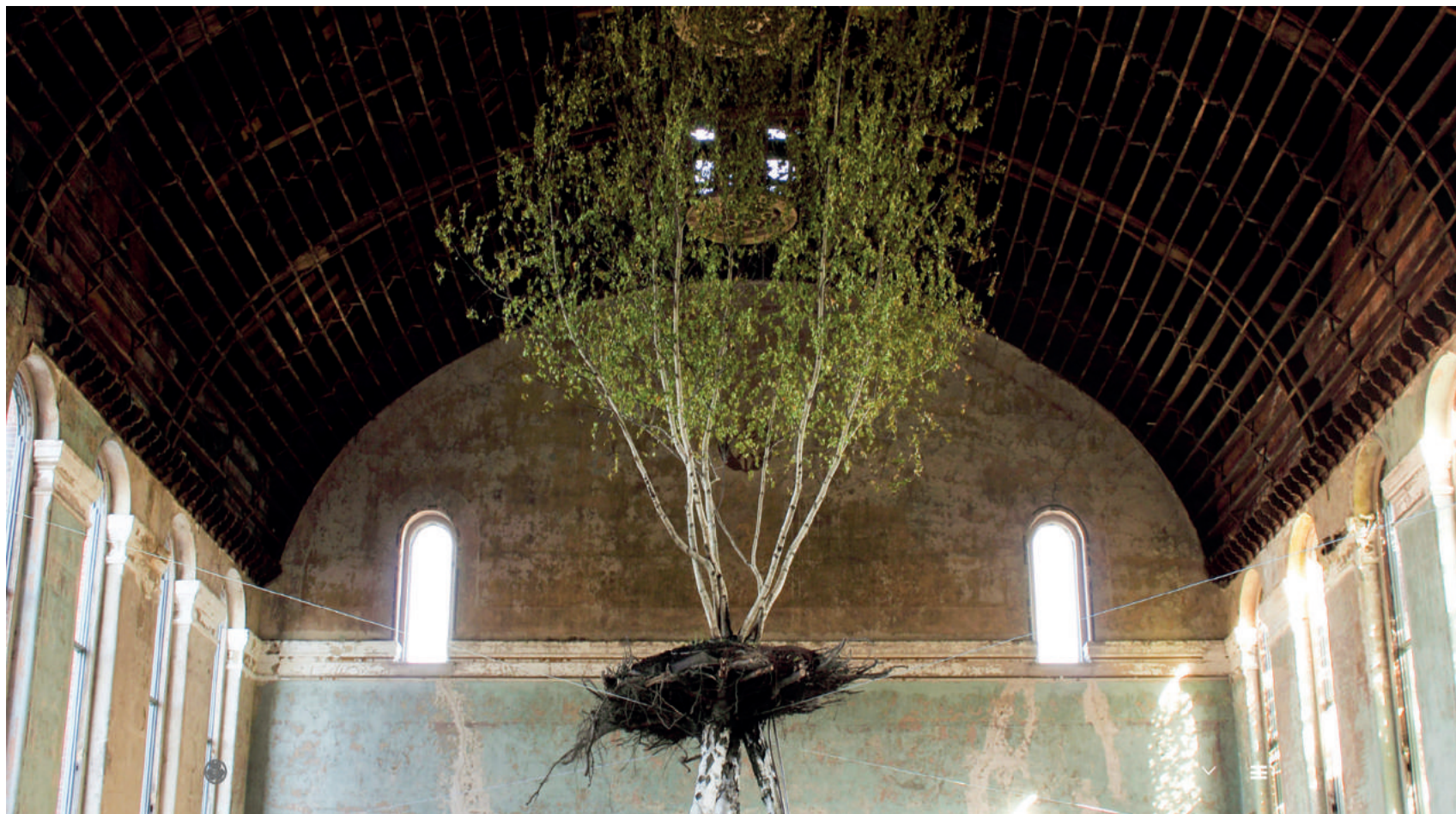
Fig.1 ShinjiTurner-Yamamoto, Hanging garden, Holy Cross, Cincinnati (USA), 2010.