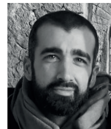
Francesco Di Lorenzo

Calamita Cosmica is the name that the artist Gino De Dominicis gave to one of his sculptures representing a gigantic skeleton. In 2011, after several relocations, the Fondazione Cassa di Risparmio di Foligno bought the work of art and placed it into the old church of Santissima Trinità in Annunziata in Foligno. This intervention represents a particular example of re-using an ecclesiastical space, where a single work found a perfect location and an appropriate exhibition strategy. After the analysis of similar experiences, this paper proposes a consideration about the reuse of churches as contemporary art galleries and about its coexistence with the sacred place.