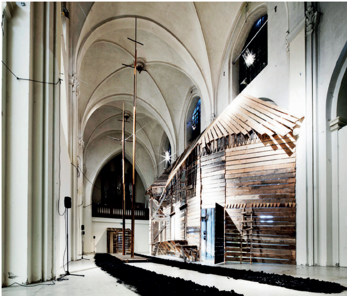
Fig. 5 Opere della Copenhagen Contemporary Art Centre, presso l'ex chiesa di St. Nikolaj, Copenhagen.