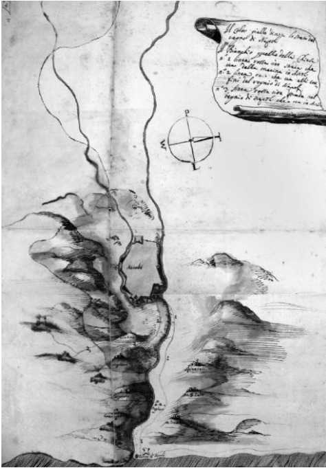
Fig. 2- L.F. Marsili, Pianta di Ascoli e topografia di que' confini col Regno di Napoli con la fortezza di Porto d'Ascoli , 1708, BUB, Fondo Marsili, ms. 1044, 72 E, [6] 10

In questo tratto, si colloca il forte Malatesta anch'esso ricostruito sui resti di precedenti architetture. L'area ha ospitato come prima costruzione un impianto termale di epoca romana. Alcuni studi ipotizzano la presenza di precedenti strutture difensive realizzate dai Piceni per rinforzare l'ingresso alla città dopo l'avvenuta disfatta, del 91 a.C., ai danni degli ascolani inflitta da Gneo Pompeo Strabone.