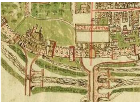
Fig. 3- Stralcio della zona di levante, da una mappa del XVI secolo (ASAP, ASCA, b. 19)

In questo tratto, si colloca il forte Malatesta anch'esso ricostruito sui resti di precedenti architetture. L'area ha ospitato come prima costruzione un impianto termale di epoca romana. Alcuni studi ipotizzano la presenza di precedenti strutture difensive realizzate dai Piceni per rinforzare l'ingresso alla città dopo l'avvenuta disfatta, del 91 a.C., ai danni degli ascolani inflitta da Gneo Pompeo Strabone.