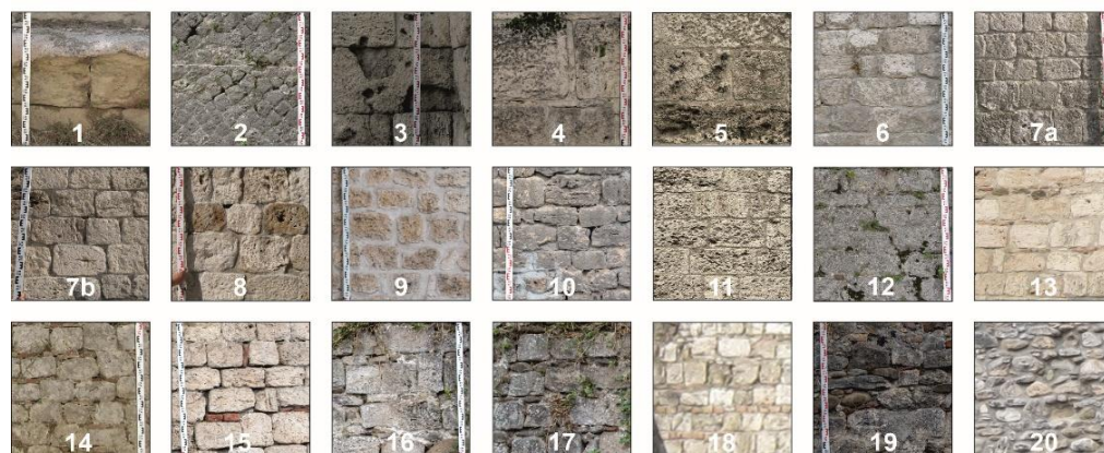
Fig. 6 - Alcuni dei principali campioni di USM individuati lungo il circuito delle mura di Ascoli Piceno