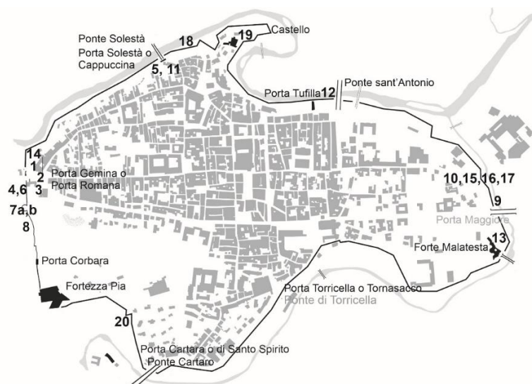
Fig. 5 - Carta del centro storico di Ascoli Piceno con l'individuazione delle principali USM lungo il circuito murario

I paragrafi 1, 2 sono stati elaborati da E. Petrucci; il paragrafo 3 da M.G. Putzu.