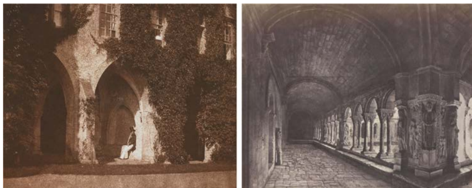
Fig. 1 - a. William Fox Talbot, Lacock Abbey , 1842, stampa su carta salata da negativo su carta (calotipo). b. Édouard Baldus, Chiostro di Saint-Trophime ad Arles , 1851, stampa su carta salata da negativi su carta.

L'interesse per gli edifici religiosi coincide con la stessa nascita della fotografia: ne danno il segno le immagini del 1844 dedicate all'abbazia di Lacock da Henry Fox Talbot 2 o quelle di Édouard Baldus del chiostro di Saint-Trophime (fig. 1) ad Arles realizzate nell'ambito la Mission héliographique 3 nel 1851, storica ricognizione fotografica dei beni storico-architettonici francesi che si occuperà della ripresa di numerosi edifici religiosi.