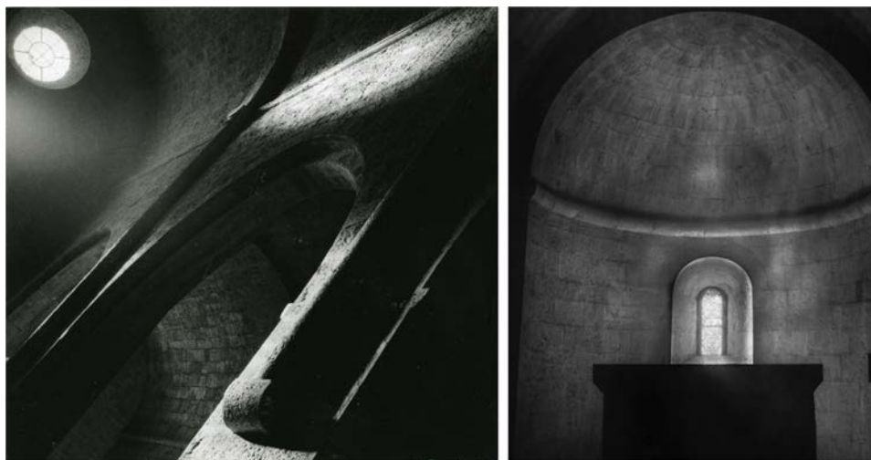
Fig. 4 - Lucien Hervé, Le Thoronet , 1952-1954 [da CALI 1956].