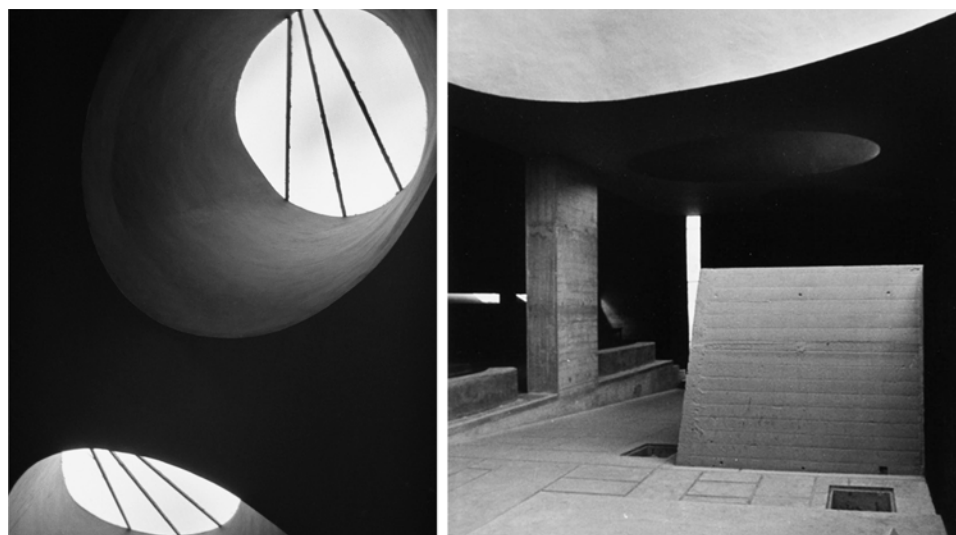
Fig. 7 - Lucien Hervé, Le couvent de la Tourette (interni), 1959 [da SBRIGLIO 2011].

Ad integrare l'approccio di Hervé, lo stesso Le Corbusier coinvolge Pierre Joly e Véra Cardot 47 . Interessati a rappresentare anche gli aspetti sociali delle architetture corbusieriane, presentano il convento insistendo in maggior misura nell'evidenziare le qualità plastiche rispetto alla tensione alla geometrizzazione e all'astrazione che caratterizza le riprese di Hervé 48 .