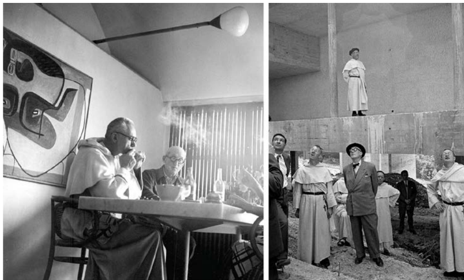
Fig. 2 - a. Lucien Hervé, Le Corbusier e Marie-Alain Couturier , 1953 [J. Paul Getty Trust, The Getty Research Institute, Los Angeles (2002.R.41)]. b. René Burri, Le Corbusier sul cantiere de La Tourette , 1959 [da RÜEGG 1999].

In questo contributo si vogliono analizzare queste relazioni, muovendo dalla rappresentazione fotografica di due edifici conventuali – Le Thoronet e La Tourette – costruiti a otto secoli di distanza. Un legame che trova un punto nodale nell’incontro tra tre personalità importanti per la cultura artistica: Le Corbusier (1887-1965), il frate domenicano Marie-Alain Couturier (1897-1954) e il fotografo Lucien Hervé 5 (1910-2007). È una storia di “incontri”, cercati ma anche casuali. Incontri tra uomini speciali, ma anche “incontri” con architetture singolari (fig. 2).