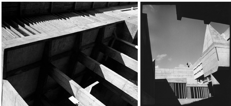
Fig. 6 - Lucien Hervé, Le couvent de la Tourette (esterni), 1959 [da SBRIGLIO 2011].

procedimento che predilige una visione ravvicinata dell'architettura in una continua scoperta di "esperienze visive":