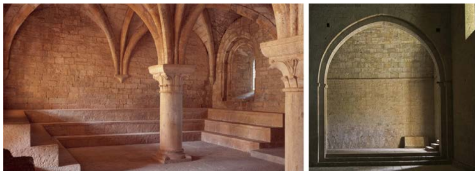
Fig. 5 - Hisao Suzuki, Le Thoronet (Leçons du Thoronet), 2005 [da PAWSON 2006].

È importante notare come le fotografie di Suzuki consegnino un'immagine particolare dell'abbazia. L'uso del colore dà conto di una delle particolarità della pietra: non più solo la texture evidenziata da Hervé, ma anche i particolari riflessi cromatici dati anche dalla presenza di bauxite nei blocchi di calcare utilizzati per la costruzione dell'edificio.