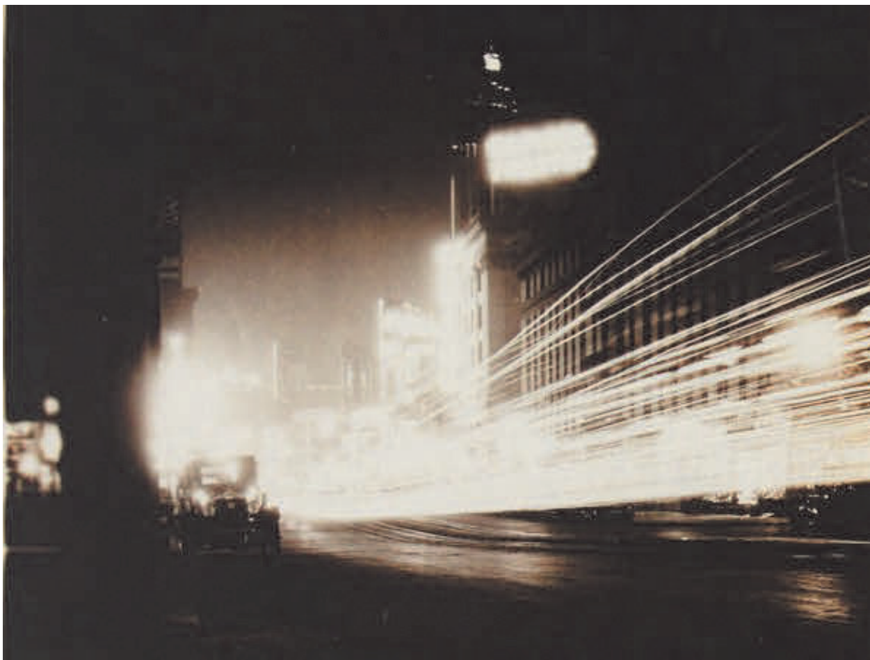
1: Erich Mendelsohn, Knut Lönberg-Holm, Times Square , New York, 1925 c.

La presenza delle scie luminose delle auto era ovviamente, come detto, un sinonimo di modernità. Come pure fondamentale era l'importanza che i fotografi avevano riservato ai neon nei prospetti e negli interni dei negozi e delle attività commerciali. Una scelta consapevole degli architetti (e in primis di Mendelsohn) per poter interagire con i paesaggi notturni delle metropoli.