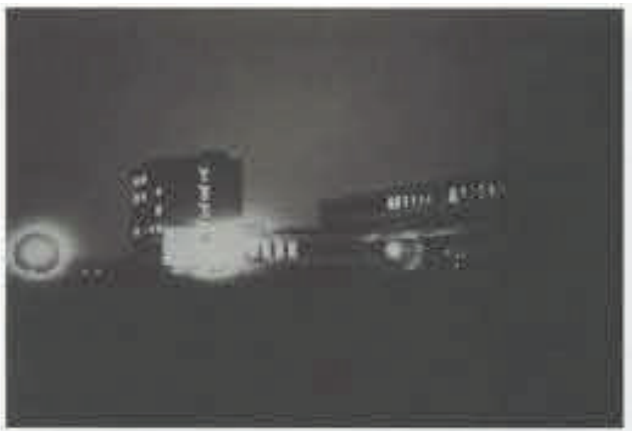
4: Lionel Feininger, Edifici del Bauhaus, Dessau 1930 c.

La sua attività abbraccia anche il cinema. Umbo, infatti, lavora anche per Walter Ruttmann (1887-1941) in Berlino sinfonia di una grande città (1927), e nutre un grande interesse per i lavori di Aleksandr Rodčenko (1891-1956). Non è un caso che anche lui prediligesse una visione dall'alto. Lavorare sulle ombre, però, è il suo vero tratto caratteristico. Tra l'altro è uno dei pochi fotografi intellettuali che combatte il nazismo e per questo è costretto ad abbandonare la Germania. Dopo la guerra sparisce, ma